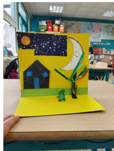
Exemples de réalisations © Marie Özveri